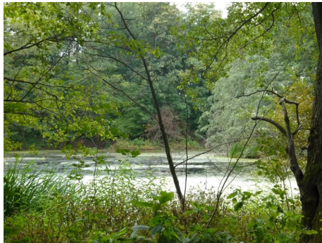
Widok na staw parkowy 2018 r.

Pokaz zdjęć wzbogacony omówieniem poszczególnych fotografii. Czas trwania ok. 25 minut