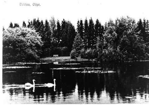
Widok na staw parkowy przed 1945 r.