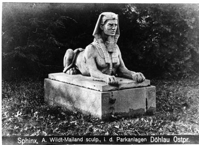
Sphinx, A. Wildt-Mailand sculp., i. d. Parkanlagen Döhlau Ostr.