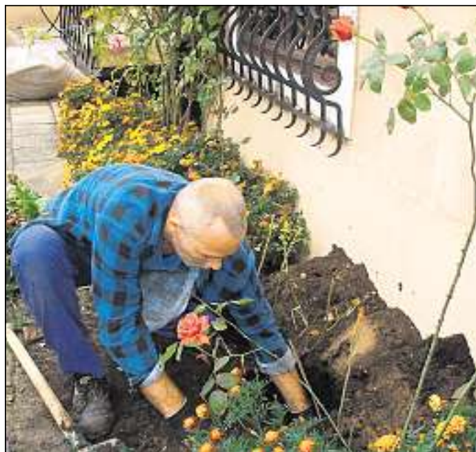
Hat einen Platz vor dem Herdermuseum im ostpreußischen Moraq (Mohrungen): Die Herderrose wurde noch vor dem Wintereinbruch eingepflanzt.

Daraus entstand die Idee, einen Trieb dieser Rose von Weimar ins heutige Moraq zu überführen und dort vor dem Herdermuseum anzupflanzen. Vorangetrieben hat diesen Plan die stellvertretende Kreisvertreterin der Kreisgemeinschaft Mohrungen in der Landsmannschaft