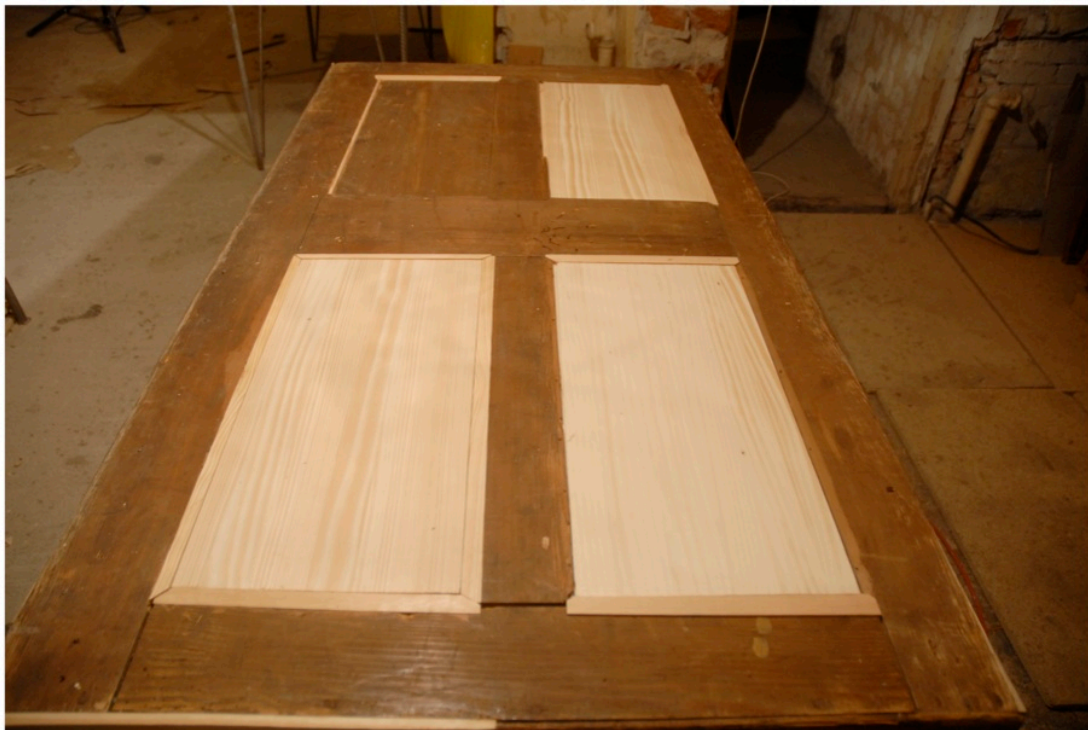
Wymienione płyciny w plecach szafy.