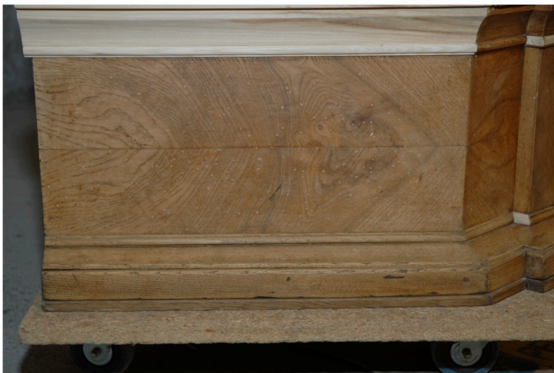
Wypełnione otwory po owadach.