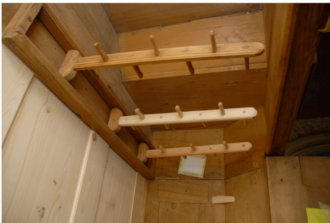
Zrekonstruowane wieszaki we wnętrzu szafy.