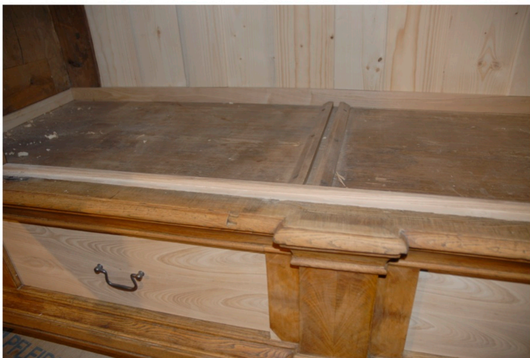
Uzupełniona listwa stopująca