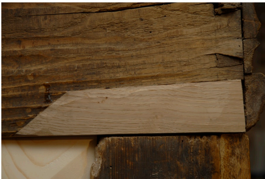
Flek w plecach górnego wieńca.