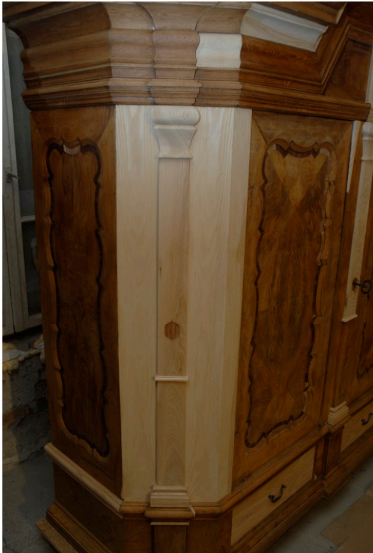
Zrekonstruowany lewy bok korpusu szafy.