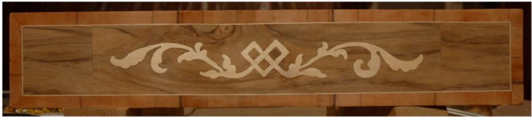
Rekonstrukcje frontów szuflad.