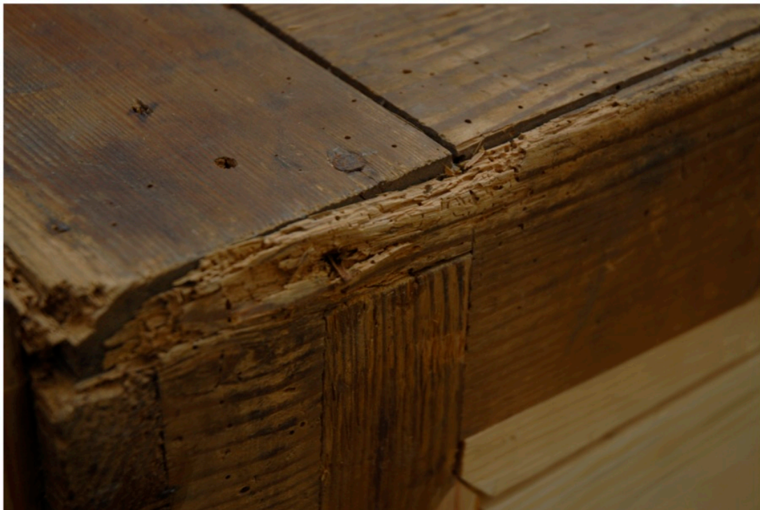
Fragment osłabiony przez drewnojady.