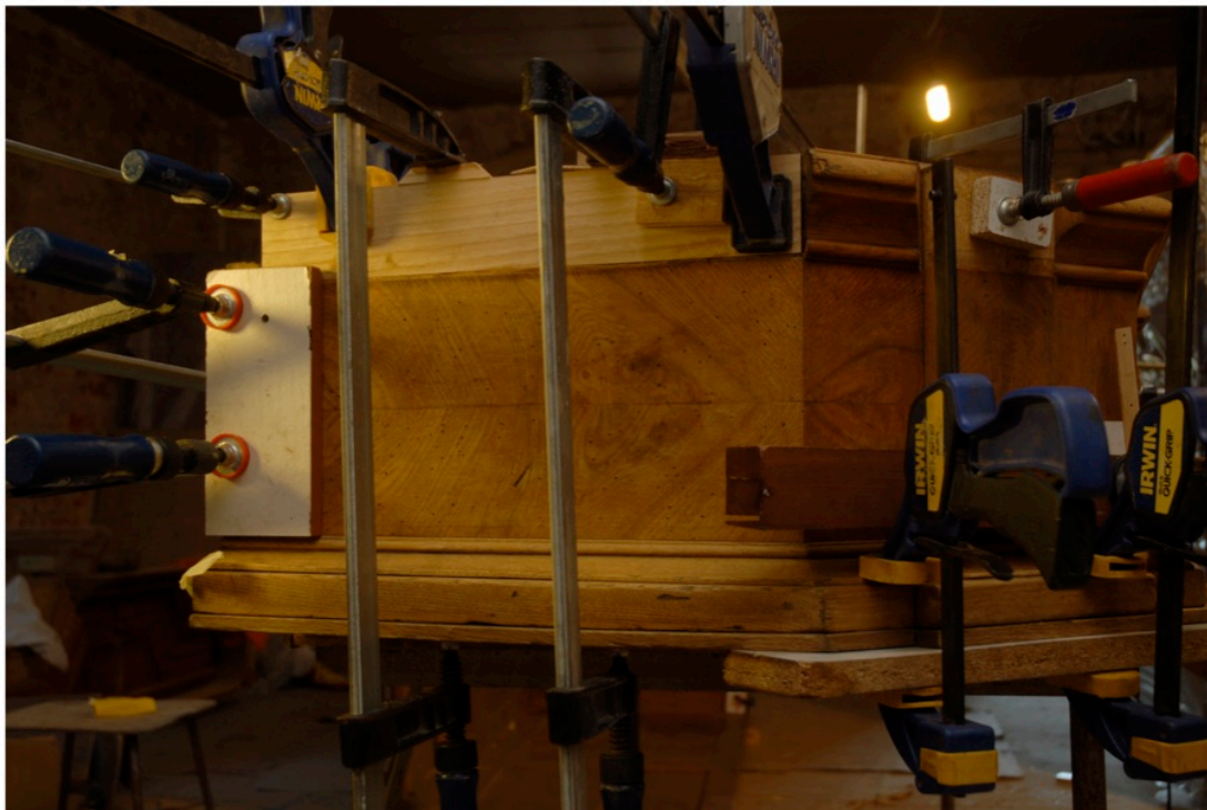
Naprawiono wyłamany fragment z wpustem na lewą część korpusu szafy.