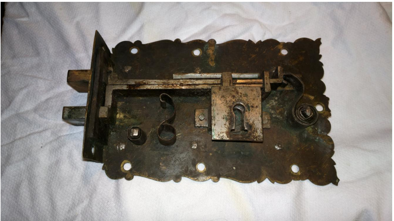
Uszkodzenia zamka: pęknięta sprężyna rygla dolnego, oraz brak bolca centrującego, w otworze kluczowym.