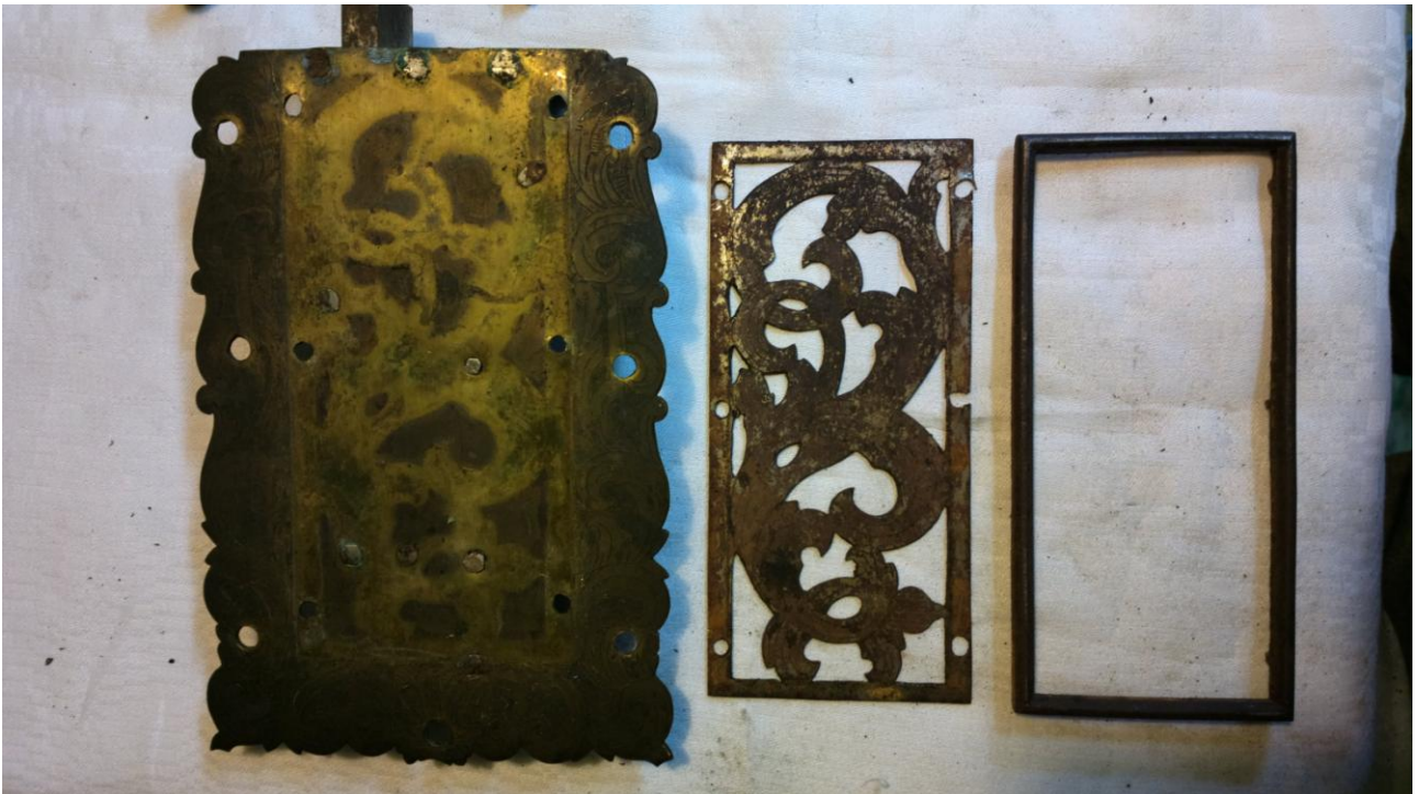
W celu ponownego przymocowania mechanizmu zabezpieczającego została zdjęta stalowa, grawerowana maskownica z ramką.