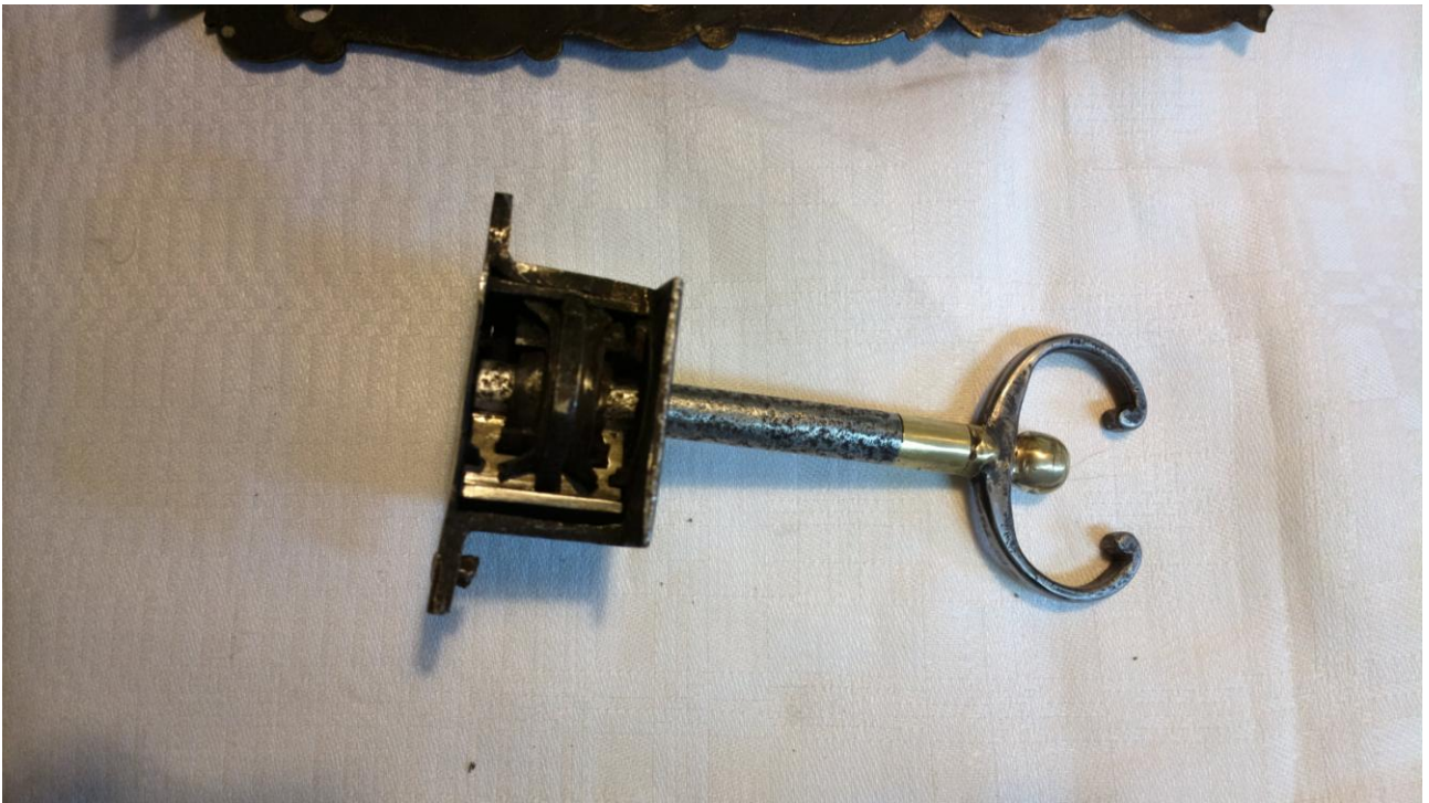
Gotowy klucz dopasowany do zamka.