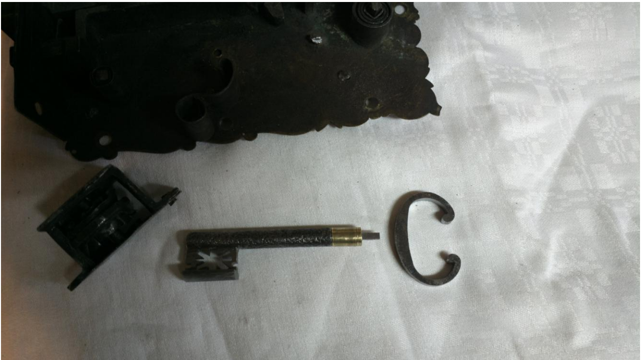
Kolejny etap rekonstrukcji klucza.