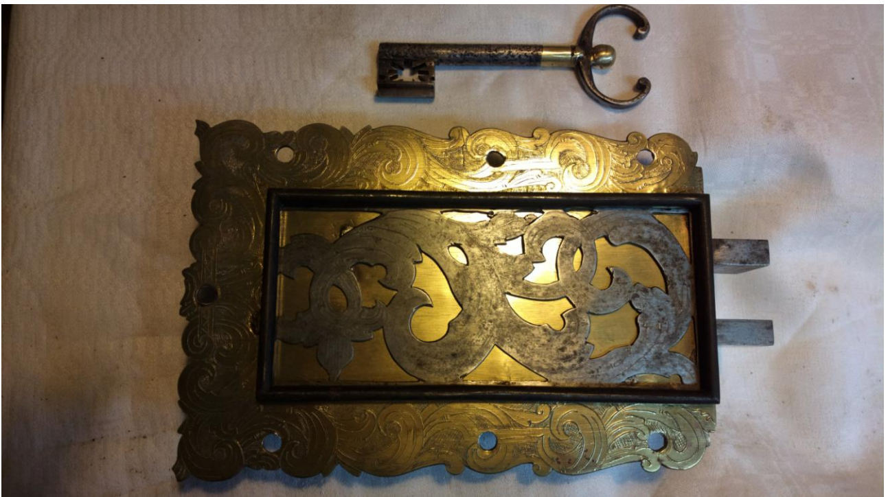
Naprawiony zamek od strony zewnętrznej.

Opracował: Jacek Gryszkiewicz, Dobrze Miasto dnia 15.06.2015r.