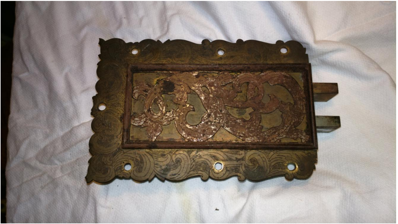
Zamek od strony zewnętrznej,