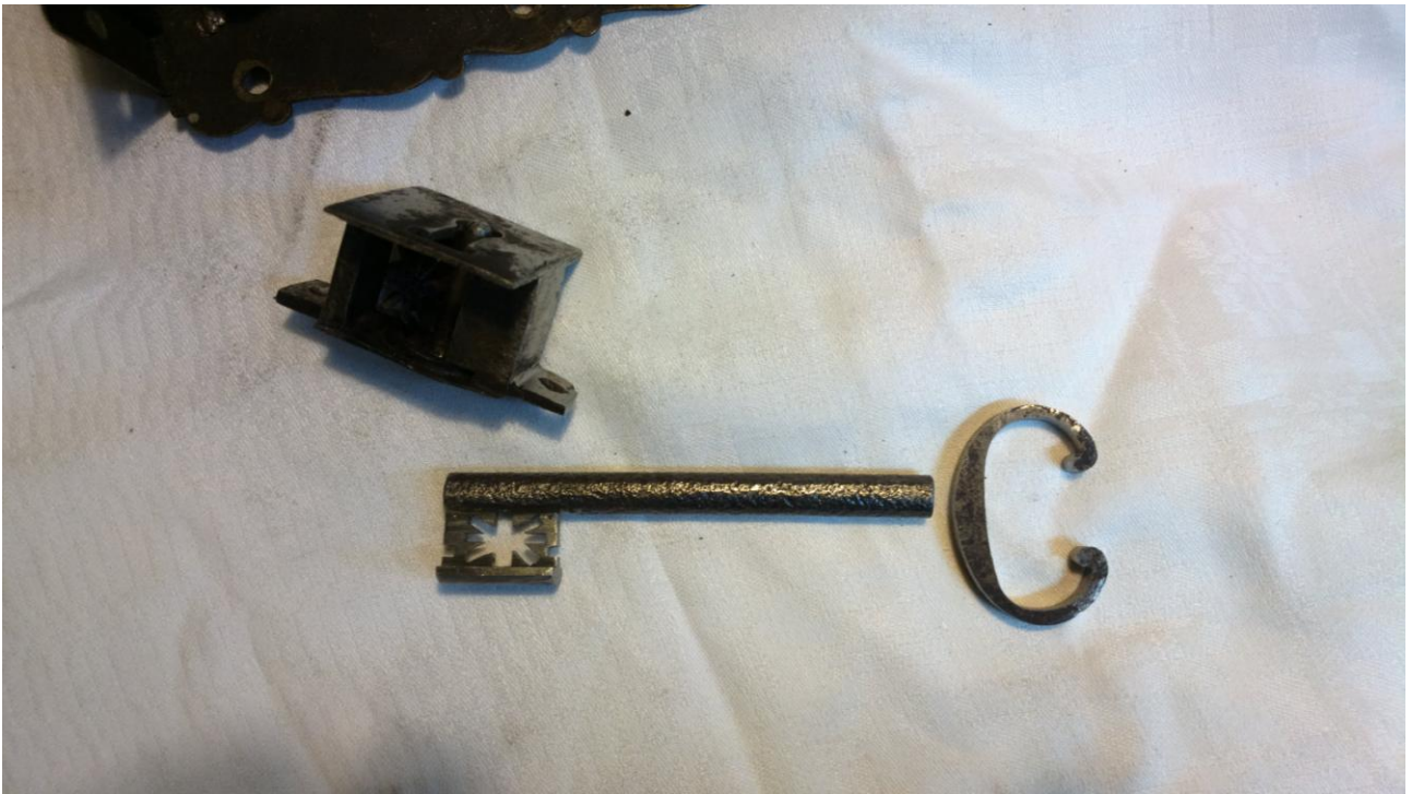
Kolejny etap rekonstrukcji klucza.