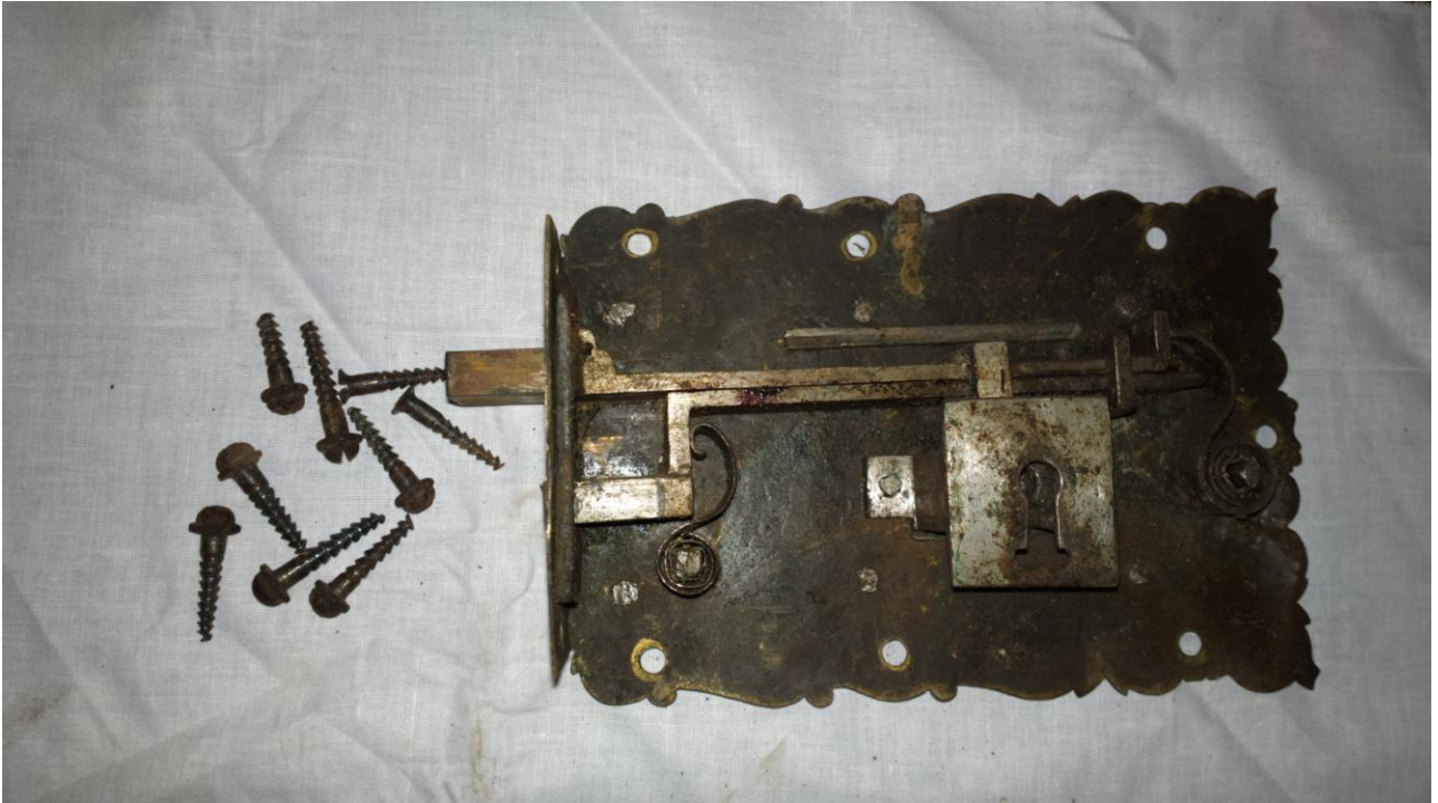
Zdemontowany zamek od strony wewnętrznej, wraz z wkrętami mocującymi.