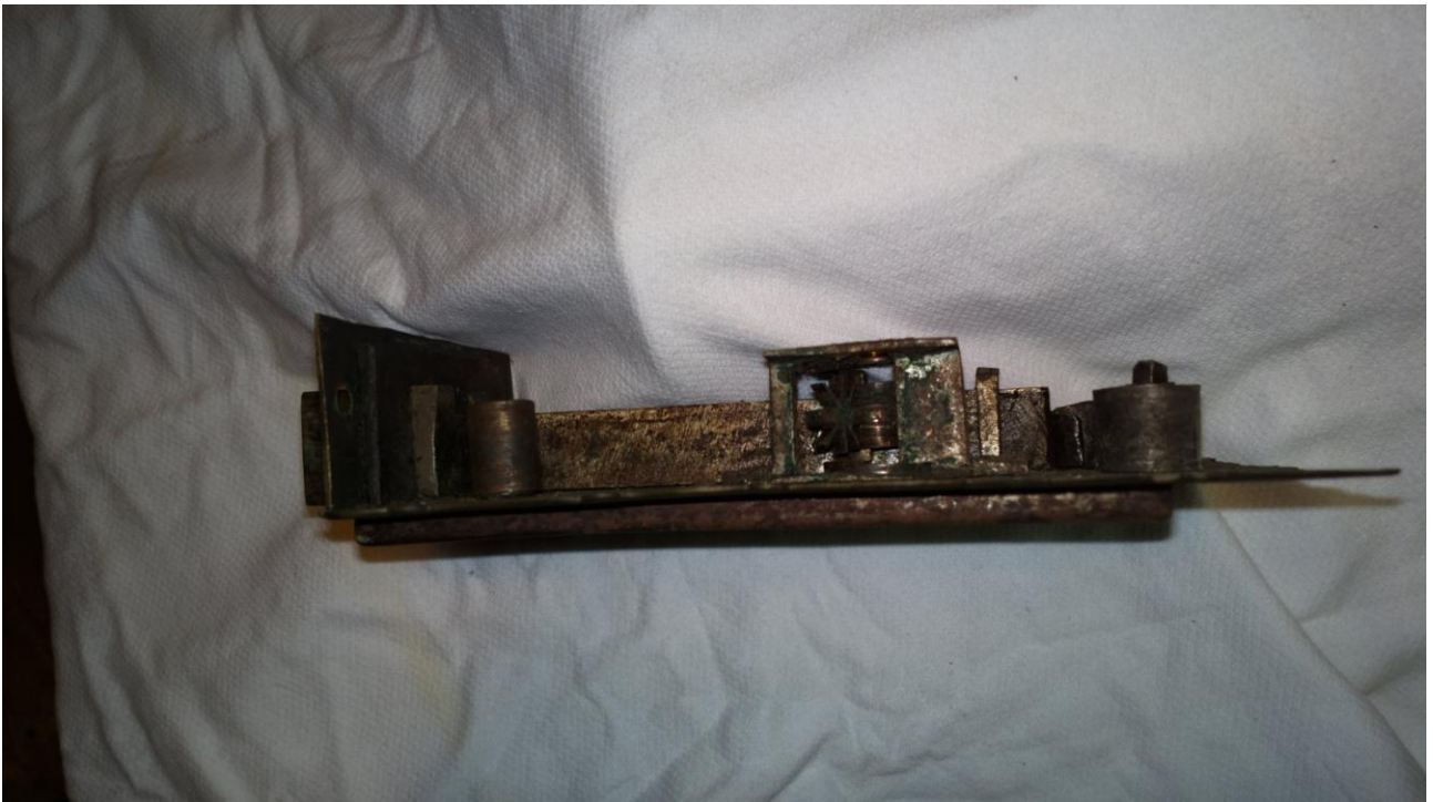
Zamek od dołu. Widoczne skomplikowane urządzenie zabezpieczające.