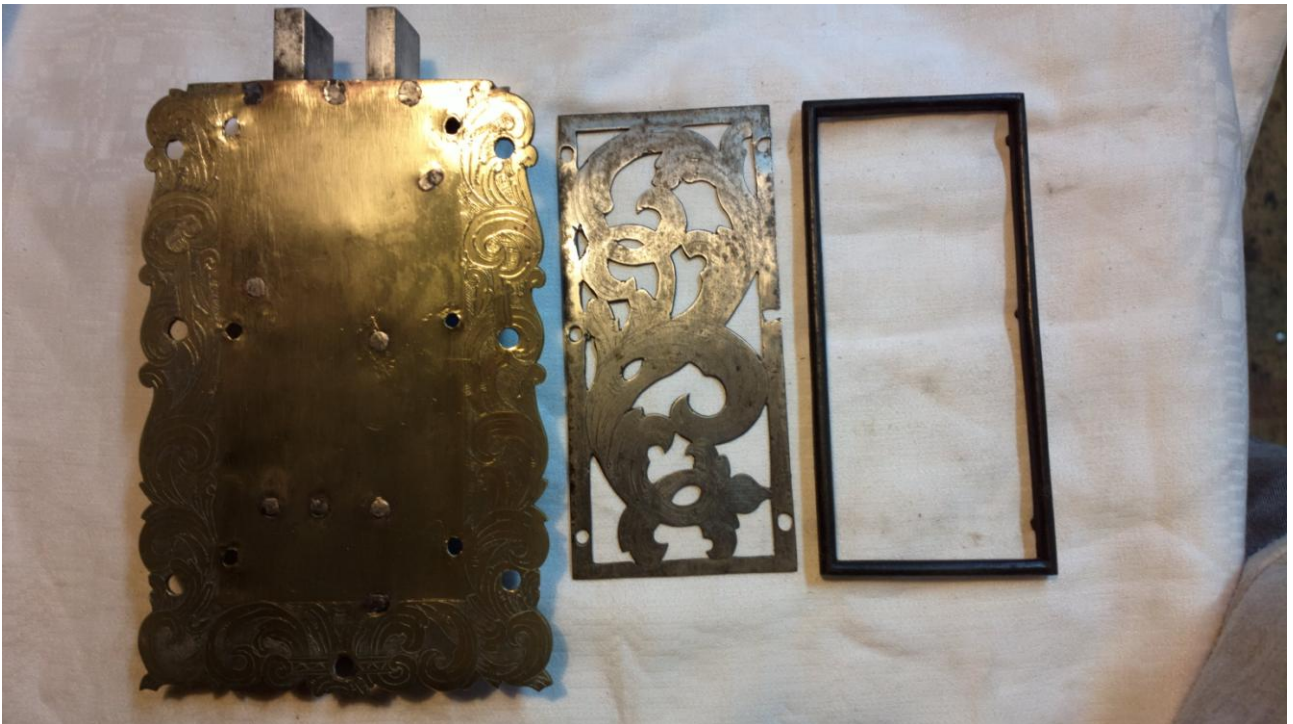
Zewnętrzne części zamka, po chemicznym usunięciu nalotów.