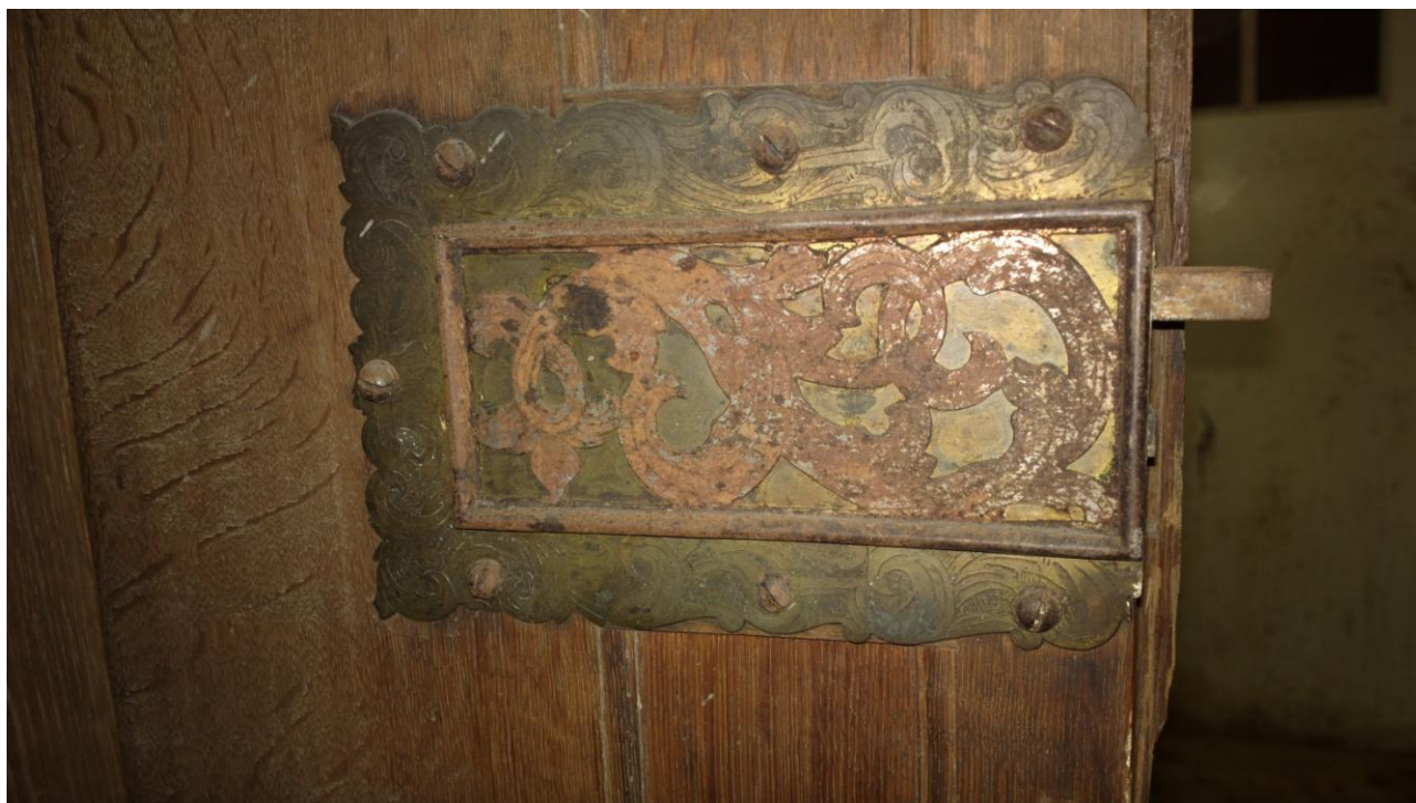
Oryginalny zamek półwpuszczany z dwoma ryglami .