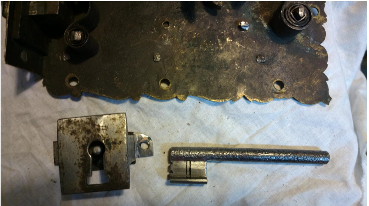
Mechanizm zabezpieczający ze zrekonstruowanym bolcem centrującym, oraz częścią rekonstruowanego klucza.