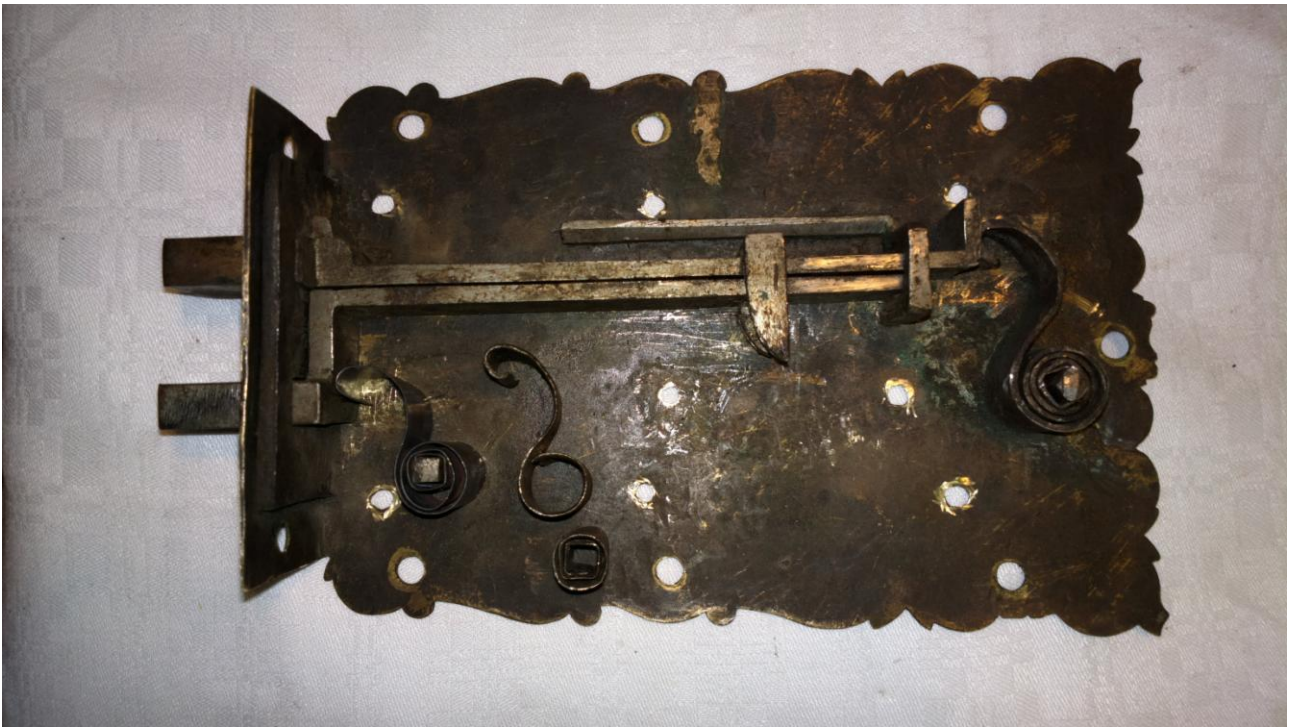
Wnętrze zamka, z nową sprężyną wysuwającą rygiel dolny.