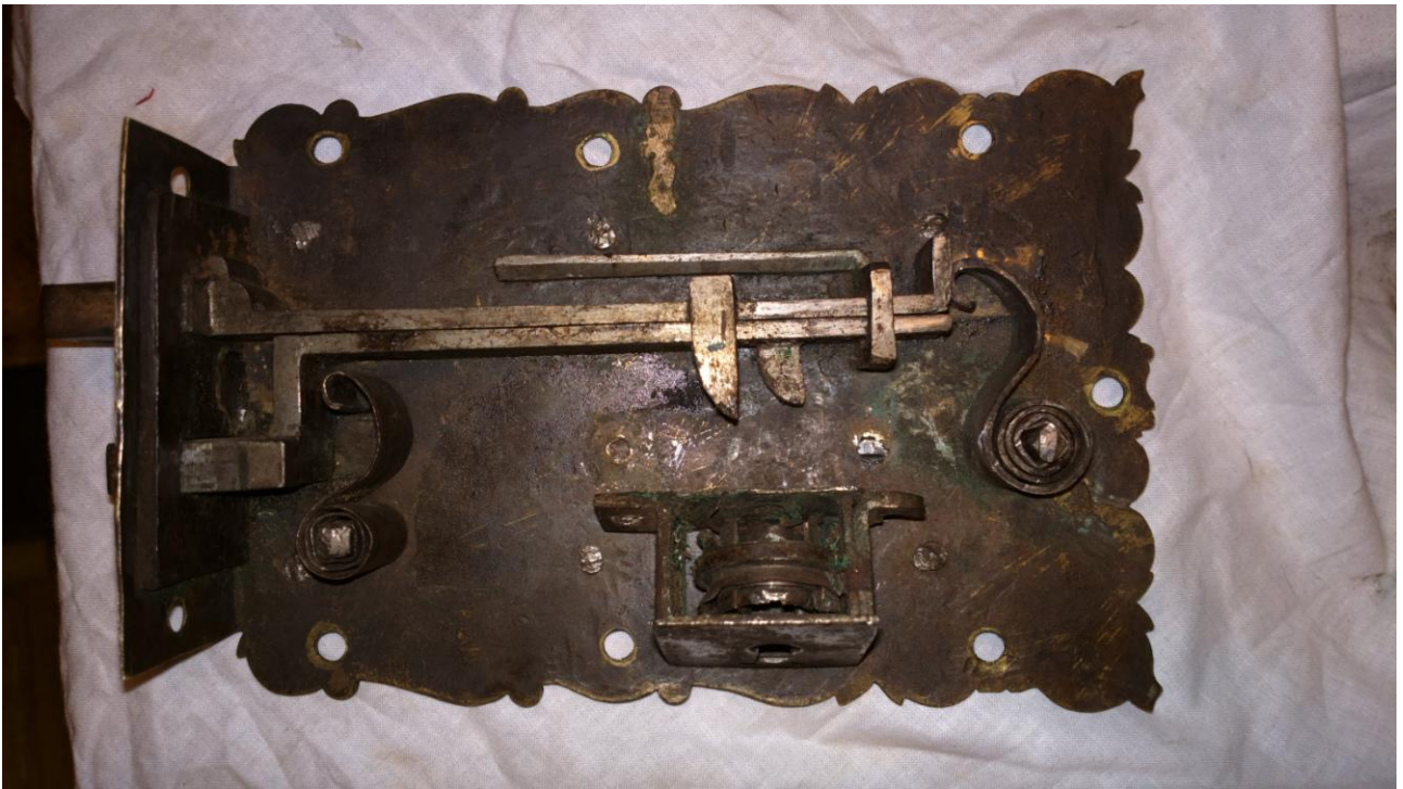
Zamek ze zdemontowanym mechanizmem zabezpieczającym.