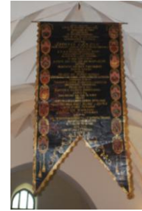
Błaszana chorągiew z herbami