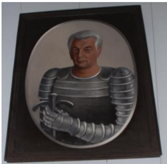
W ostatniej sali trzeba wysoko zadrzeć głowę