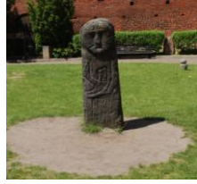
Baba pruska – wystarczy się rozejrzeć