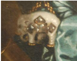
Order na jednym z portretów... (pierwszy z prawej)