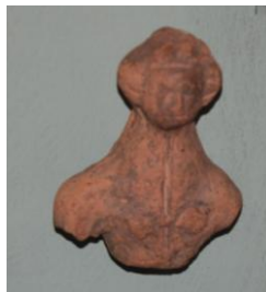
Figurka wykopana przez archeologów