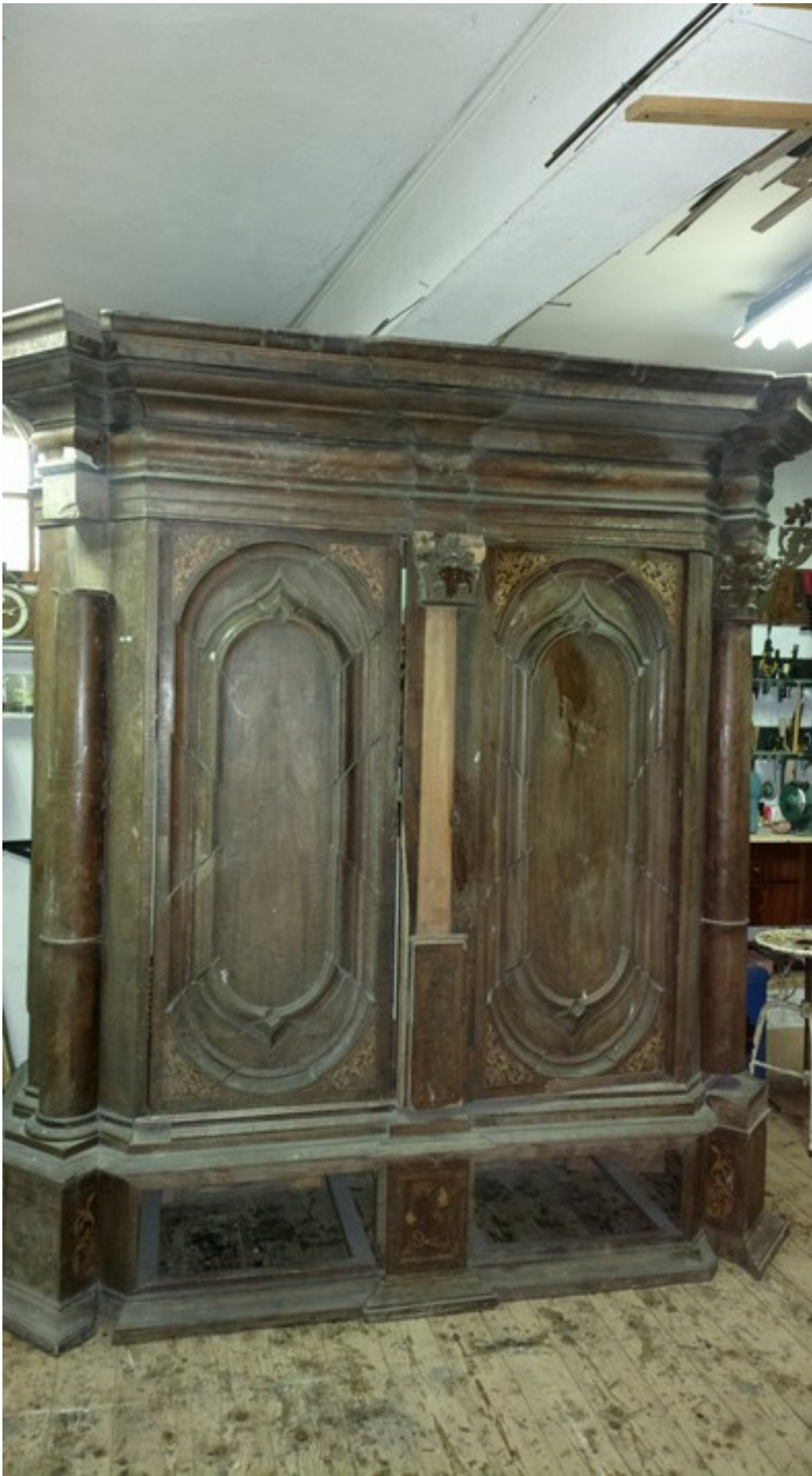
Szafa sieniowa Mb-54-OMO ustawiona, w pracowni.