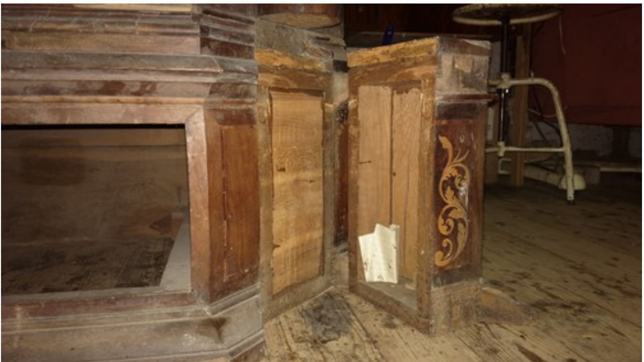
Po odchyleniu podstawy kolumny okazało się, że we wnętrzu ukryta jest złożona kartka papieru.