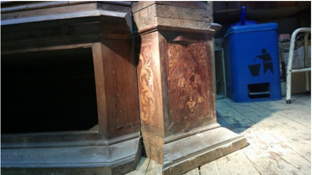
Prawa strona wieńca dolnego. Do ściętego skośnie narożnika jest przymocowana intasjowana skrzynka stanowiąca podstawę kolumny.