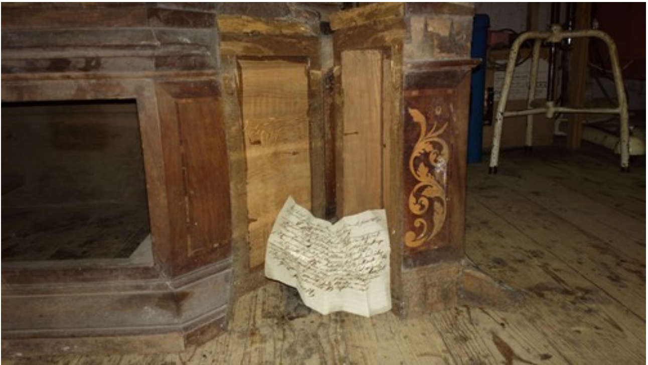
Kartka papieru po rozłożeniu okazała się listem napisanym w 1838 r. w Sztynorcie.