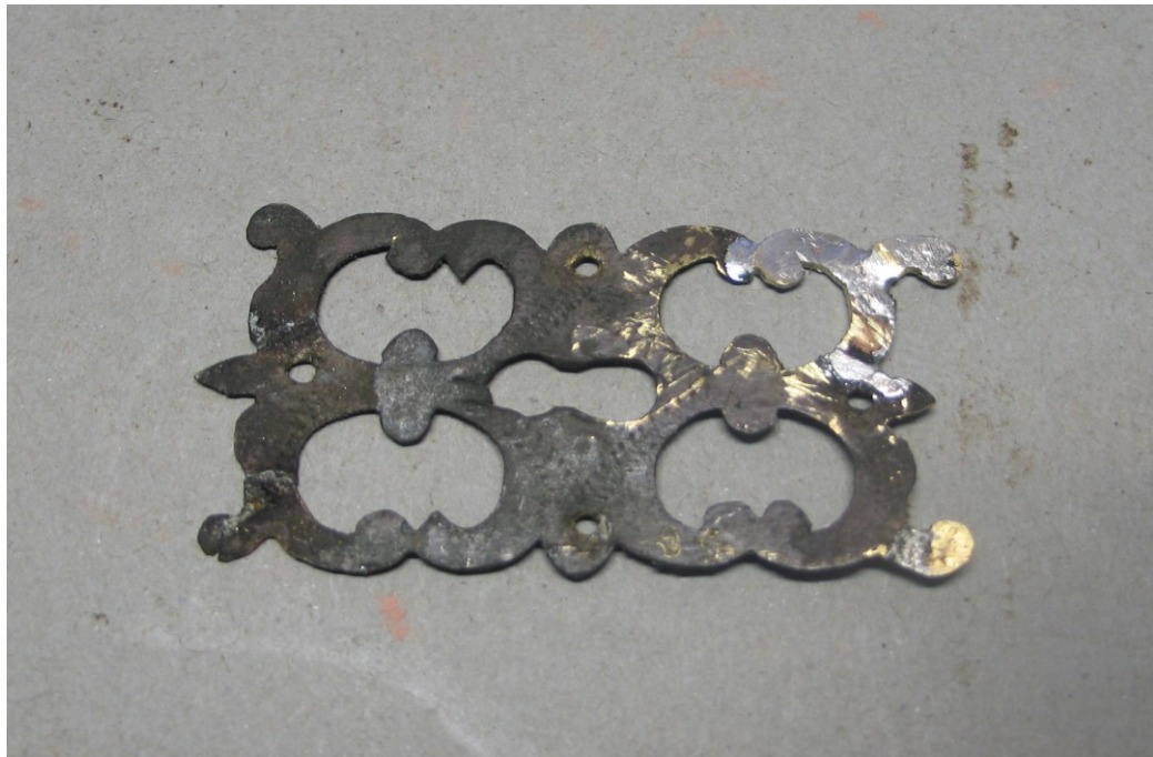
Zdj.3 Naprawione – uzupełnione okucie 2