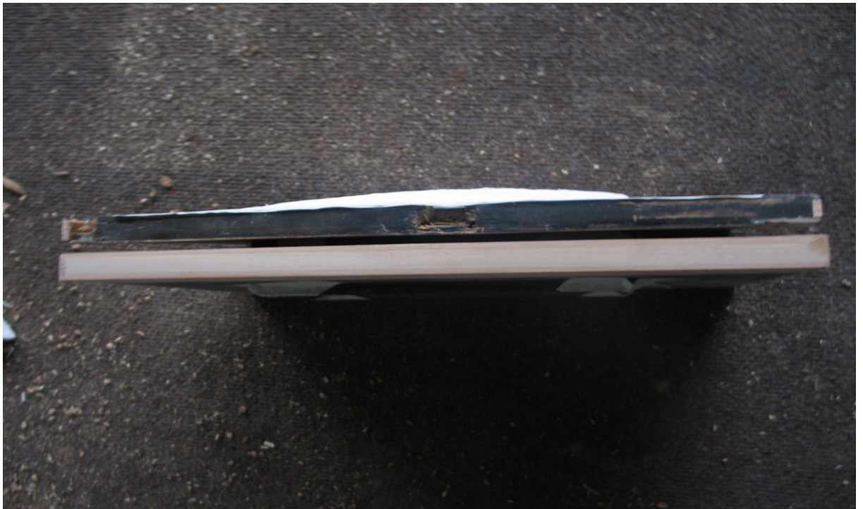
Zdj. 5 Wyprostowane drzwiczki - widok wewnętrznych krawędzi wyprostowanych drzwiczek