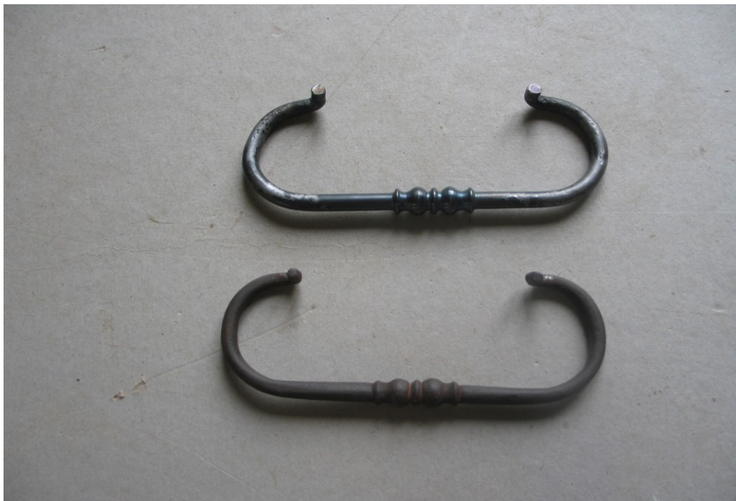
Zdj.4 zachowany ( dolny na zdjęciu ) i zrekonstruowany , żelazny uchwyt antabowy z boku obiektu