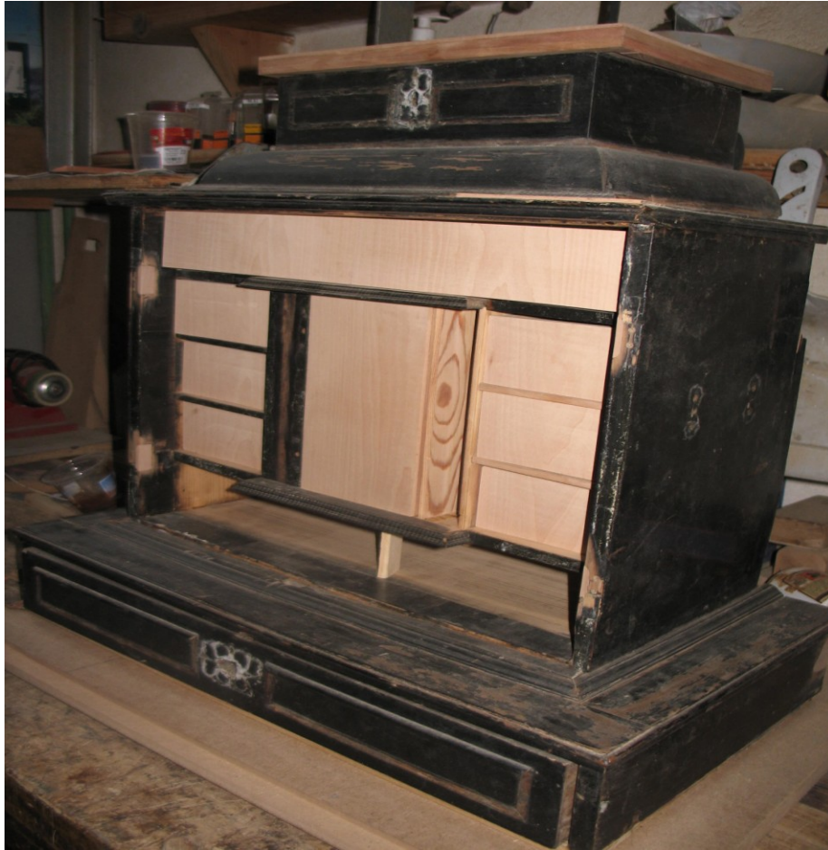
Zdj.1 Spasowane szufladki w korpusie obiektu – montaż próbny