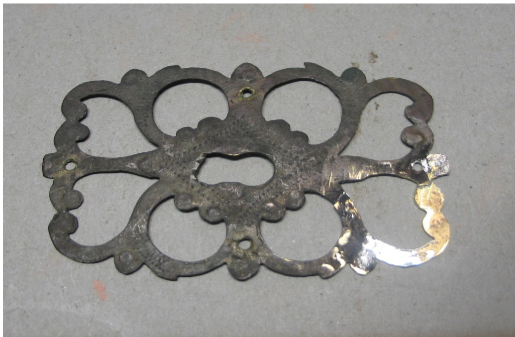
Zdj.2 Naprawione – uzupełnione okucie 1